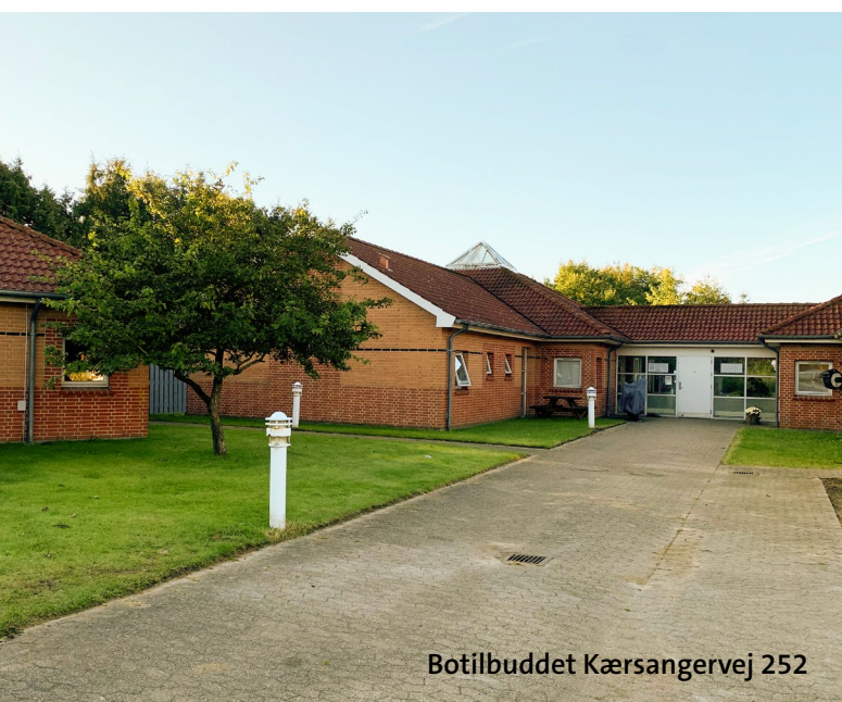
Botilbuddet Kærsangervej 252