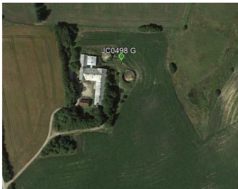
Udsnit af ansøgningens luftfoto med markering af mastens placering