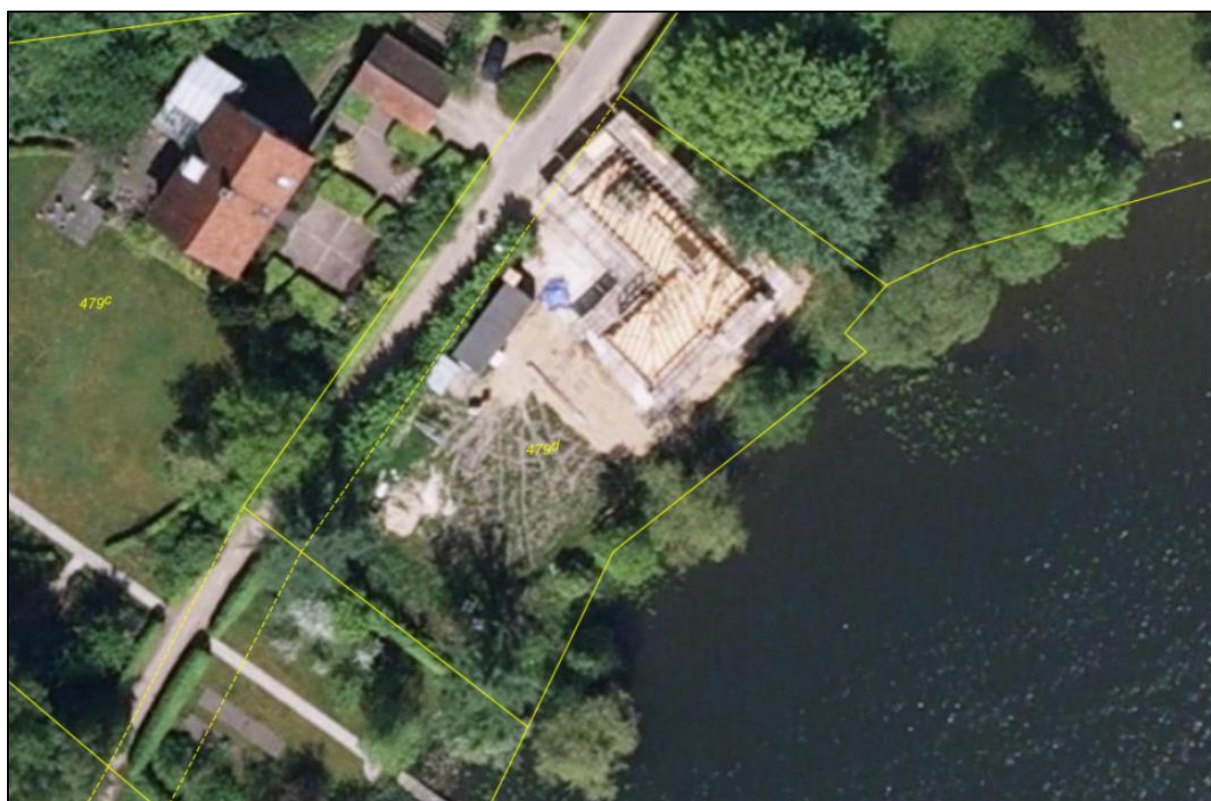
Ortofoto sommer 2008. Heraf fremgår, at der ikke var rørskov ud for matr.nr. 479d Viborg Markjorder forud for etablering af broen i 2012. Matrikelgrænser er angivet med gul streg.