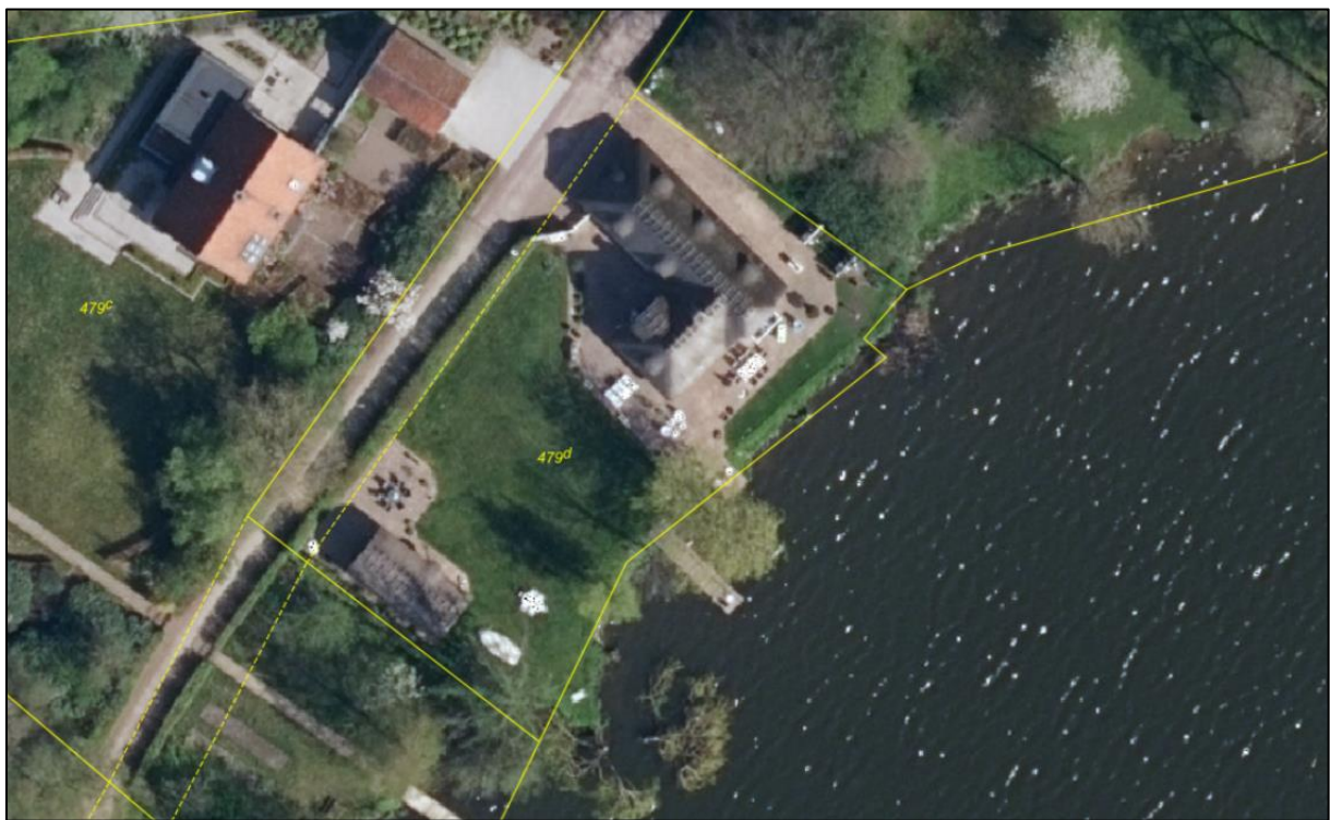
Ortofoto forår 2016. Heraf ses broen ud for matr.nr. 479d Viborg Markjorder efter den blev tilrettet ved fjernelse af platformen. Det er denne bro, der forsat er ud for ejendommen. Matrikelgrænser er angivet med gul streg.