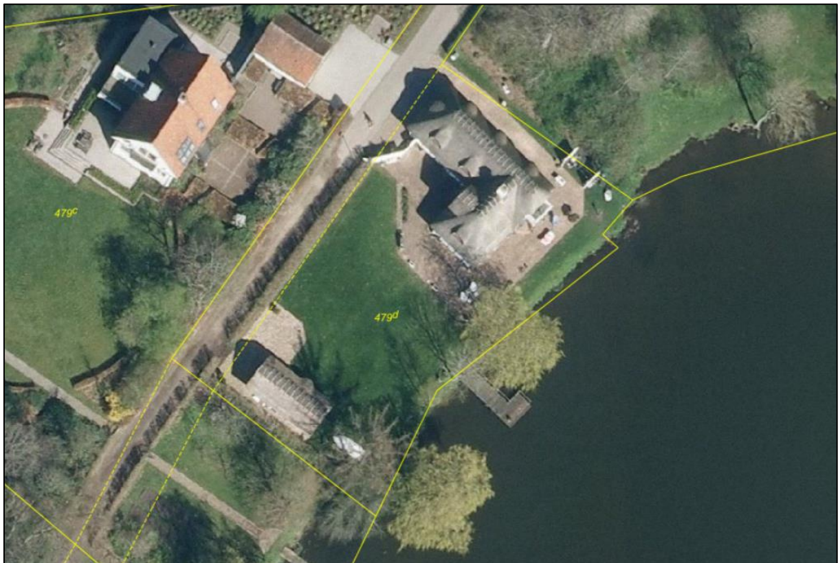
Ortofoto forår 2014. Heraf ses at der er etableret en bro med platform ud for matr.nr. 479d Viborg Markjorder. Matrikelgrænser er angivet med gul streg.