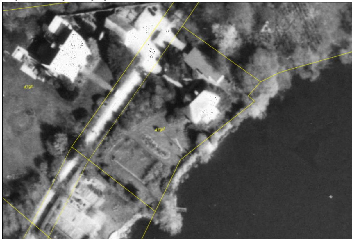
Flyfoto 1990. Heraf fremgår at der siden før 1992 har været haveanlæg ned til søbredden ved matr.nr. 479d Viborg Markjorder. Matrikelgrænser er angivet med gul streg.